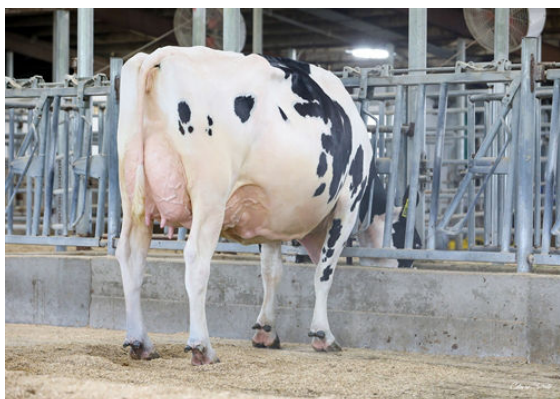
AOT DELUXE HI-LIGHTED