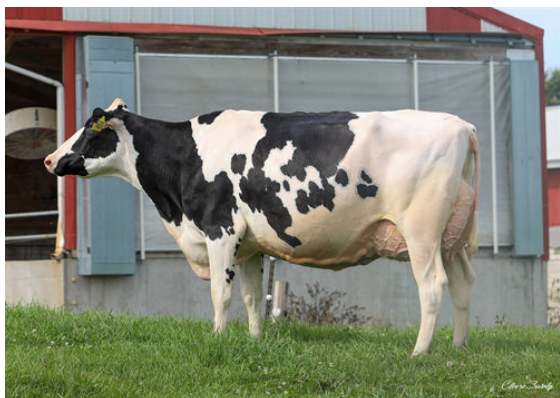
AOT DELUXE HI-LIGHTED